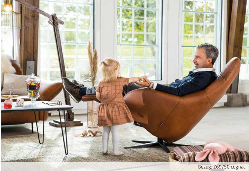
Bezug: Z69/50 cognac