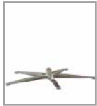
5-Sternfuß versch. Metallf.