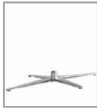
4-Sternfuß, Mehrpreis nickel-satiniert