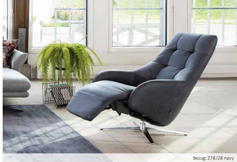
Bezug: Z78/28 navy