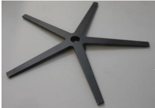
909 5-Sternfuß schwarz matt