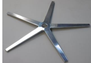
907 5-Sternfuß Aluminium glänzend