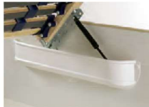
inkl. Luxus-Gasdruckfeder zum Öffnen des Lattenrahmens und Nutzung des Stauraums (nicht in Verbindung mit Motorlattenrahmen)