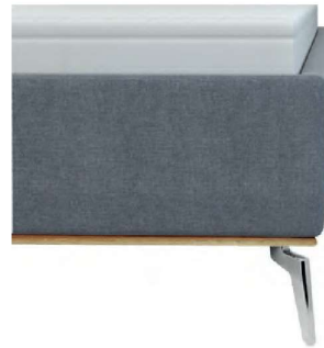
kubisch mit Sichtholzrahmen Wildeiche geölt - nur bei Fußhöhe 16 cm lieferbar - Höhe ca. 26 cm inkl. Sichtholzrahmen