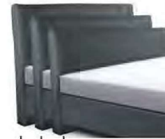
→ 1868S - Höhe 99 cm → 1868M - Höhe 109 cm → 1868L - Höhe 119 cm