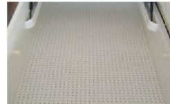
inkl. gelochter Bodenplatte für optimale Luftzirkulation