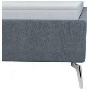
kubisch ohne Sichtholzrahmen Höhe ca. 24 cm