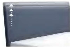
1300 Höhe 55 - 125 cm in 5 cm-Schritten kürzbar