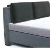
1861 Höhe 90 cm inkl. 2 losen Rückenkissen (Wende/Relax-Kissen) mit Rolle / Höhe 101 cm (nur ab Breite 160 cm möglich)