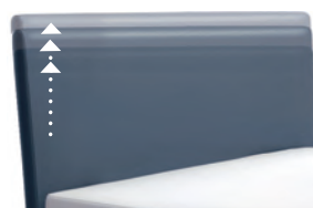
0300 Multimaß Höhe 55 - 125 cm in 5cm-Schritten kürzbar