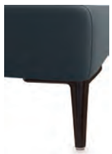
A11-10/M01 A11-15/M01 Alufuß schwarz matt