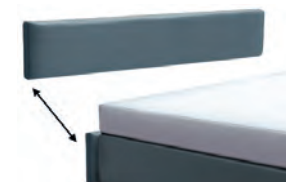
Kopfteilblende 3029 - Höhe 29 cm