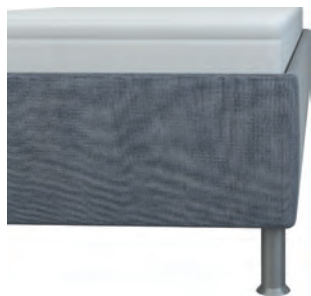
glatt Höhe ca. 29 cm