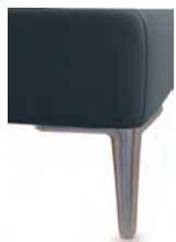
A11-10/M12 A11-15/M12 Alufuß gebürstet