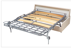
Ergoflex Lattenrost Standard