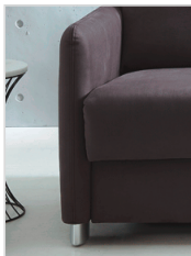
Armlehne Typ 1