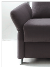
Armlehne Typ 2